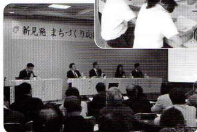
①新見発まちづくり応援隊講座のようす