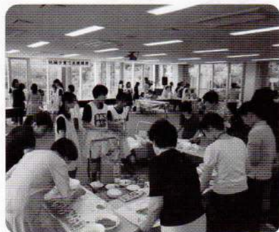
①地域子育て支援講座のようす