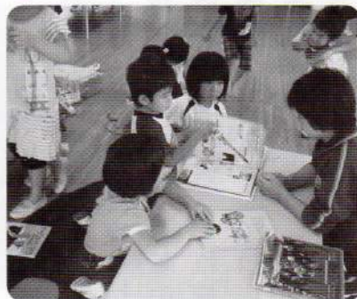
①夏のボランティア体験のようす