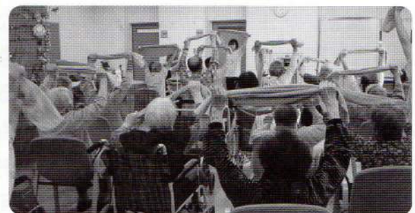
①介護保険事業（通所介護事業）のようす