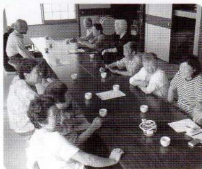
①ふれあいいいきいきサロンのようす